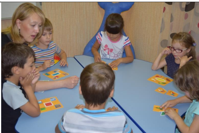
Платная образовательная услуга «Звуковичок», возраст (5-6 лет).